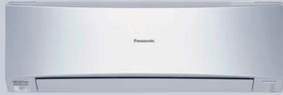
KIT-XE9-LKE // KIT-XE12-LKE