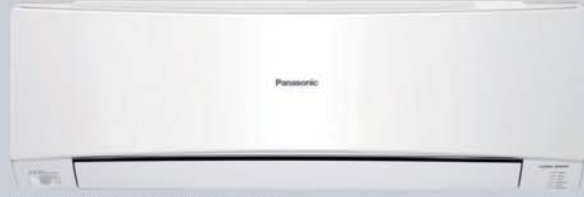
KIT-E9-LKE // KIT-E12-LKE // KIT-E15-LKE