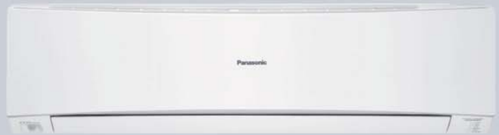
KIT-E18-LKE // KIT-E24-LKE